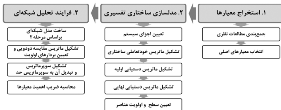
شکل ۱. روش ساخت مدل ارزیابی کیفیت طرح

انتخاب گشته‌اند که امکان تحلیل و سنجش آن از مورد مطالعاتی، ممکن باشد. در مرحله دوم، معیارهای اصلی انتخاب شده به عنوان ورودی مدل‌سازی ساختاری تفسیری استفاده شده‌اند. محاسبات این مرحله با نرم‌افزار Excel صورت گرفته است. خروجی این مرحله، ساخت مدلی شبکه‌ای از معیارهای اصلی برای ارزیابی کیفیت طرح است. این مدل، به عنوان ورودی مرحله سوم، یعنی فرایند تحلیل شبکه‌ای استفاده شده است. هدف از این مرحله، محاسبه میزان اهمیت هر یک از معیارها و همچنین میزان توجه طرح مورد مطالعه به هر یک از معیارها بوده است. محاسبات و نتایج نهایی این مرحله نیز با نرم‌افزارهای Super Decisions و Excel انجام گه است. گفتنی است موضوع ارزیابی کیفیت هر طرح، به طور عام، نوعی روش ارزیابی ذهنی محسوب می‌شود و در اغلب پژوهش‌های جهانی آن نیز تحلیل و استنتاج پژوهشگران مبنای قضاوت قرار داده شده است. از این رو، در این پژوهش نیز مراحل ساخت مدل شبکه‌ای معیارها و امتیازدهی آنها بر مبنای نتایج پژوهش‌های پیشین و امتیازدهی میزان توجه طرح مورد مطالعه به معیارها بر مبنای تحلیل محتوای طرح (مهندسان مشاور نقش جهان-پارس، ۱۳۹۰: ج ۱ و ۸) و ارائه دلایل و استنتاج آنها بوده است.