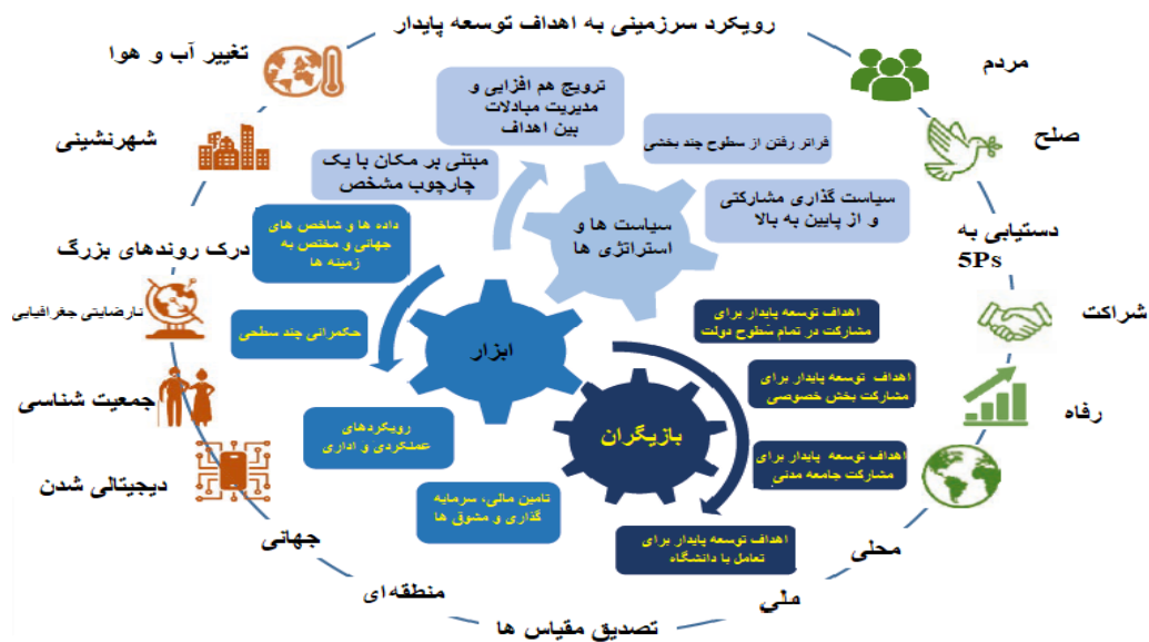
شکل ۰۱. رویکرد سرزمینی به اهداف توسعه پایدار (OECD, 2021)