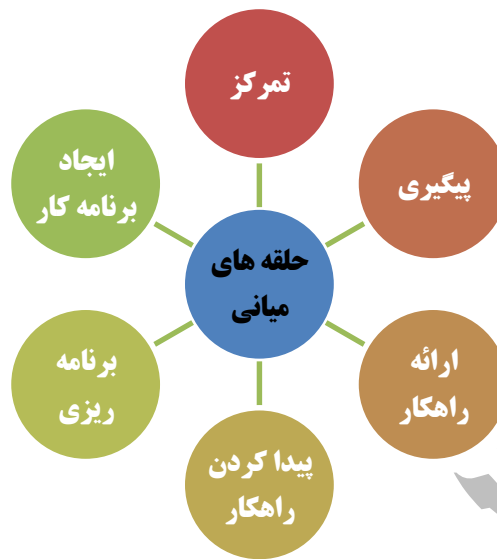
شکل ۱: وظایف حلقه های میانی در بیانات مقام معظم رهبری