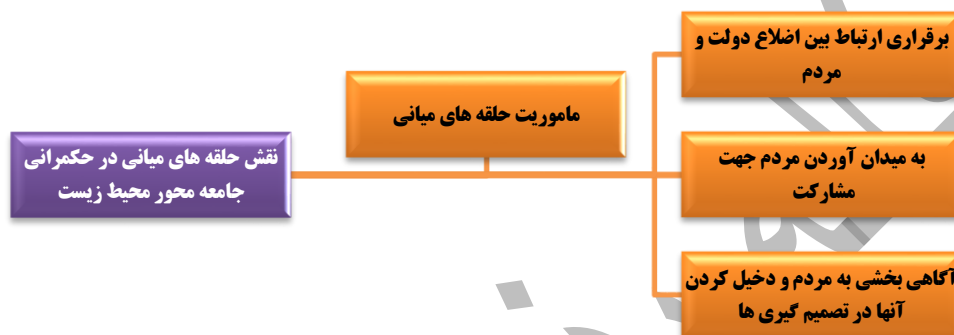
شکل ۳: مدل مفهومی مأموریت حلقه های میانی در حکمرانی جامعه نگر محیط زیست

در ابتدا پیشینه‌های پژوهش با واژگان حکمرانی مردمی از یک سو و حلقه‌های میانی و مشارکت مردمی از سوی دیگر مورد بررسی قرار گرفت. در ادامه با الهام از بیانات رهبر معظم انقلاب در دیدار با دانشجویان در خردادماه سال ۱۳۹۸، محتوای پژوهش درباره کارکرد و اهمیت حلقه‌های میانی غنی گردید. حال با توجه به مطالب بیان‌شده و باهدف تحقق حکمرانی مطلوب محیط‌زیستی در جهت نیل به تمدن نوین اسلامی، موارد ذیل استخراج شد: