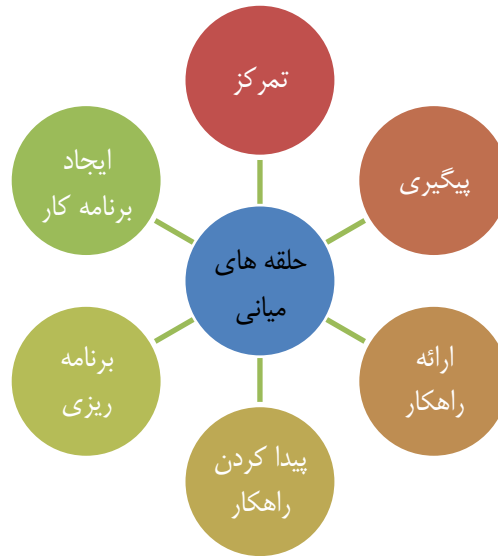
شکل ۱. وظایف حلقه های میانی در بیانات مقام معظم رهبری