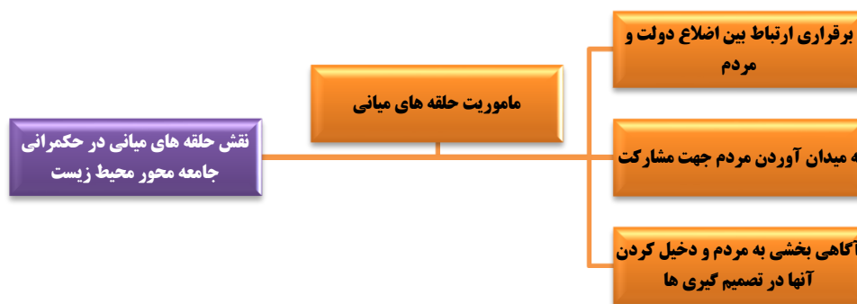
شکل ۳. مدل مفهومی مأموریت حلقه های میانی در حکمرانی جامعه نگر محیط زیست

در ابتدا پیشینه های پژوهش با واژگان حکمرانی مردمی از یک سو و حلقه های میانی و مشارکت مردمی از سوی دیگر مورد بررسی قرار گرفت. در ادامه با الهام از بیانات رهبر معظم انقلاب در دیدار با دانشجویان در خردادماه سال ۱۳۹۸، محتوای پژوهش درباره کارکرد و اهمیت حلقه های میانی غنی گردید. حال با توجه به مطالب بیان شده و باهدف تحقق حکمرانی مطلوب محیط زیستی در جهت نیل به تمدن نوین اسلامی، موارد ذیل استخراج شد: