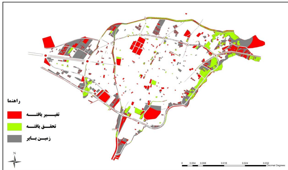
شکل ۲. نقشه ارزیابی تحقق‌پذیری کاربری‌ها بر مبنای شاخص مکان‌سنجی

وضعیت کاربری‌های پیشنهادی طرح تفصیلی شهر بجنورد بر مبنای شاخص مکان‌سنجی