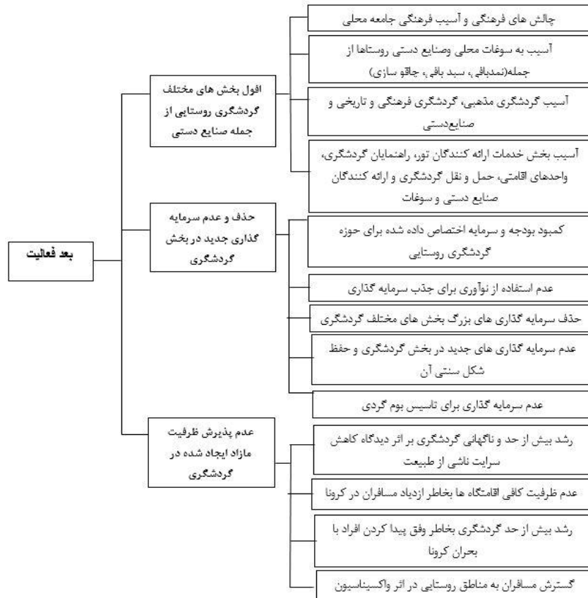
شکل ۲. مدل نهایی تحقیق

اولین موضوعی که به صورت مکرر در مرور و بازخوانی یادداشت‌های میدانی پژوهشگران به آن اشاره شده بود این بود که شیوع کرونا به تعطیلی اقامتگاه‌ها و جاذبه‌ها انجامید و در پی آن مشاغل و کسب‌وکارهای گردشگری با افت بسیار شدید مواجه شدند که در نتیجه به عدم استفاده و ناشناخته ماندن و از بین رفتن ظرفیت‌های انسانی و طبیعی و فرهنگی برخی روستاهای گردشگری منجر شد. در ابتدای همه‌گیری کرونا موارد یادشده شامل روستای سولقان نیز شد. در عین حال، به دلیل نزدیکی این روستا به شهر تهران و نیز وجود خانه‌های دوم ساکنان شهر تهران، شاهد ورود گردشگرانی از شهر تهران بوده‌ایم. اما فعالیت‌های گردشگری و ورود گردشگران به اماکن تفریحی متوقف شدند. پس از ورود و تزریق واکسن کرونا این روستا با حجم زیادی از ورود گردشگران مواجه شد. این اتفاق در عین اینکه باعث رونق مجدد کسب‌وکارهای گردشگری شد مشکلاتی برای طبیعت و محیط زیست منطقه به وجود آورد که در تحقیق به آن اشاره شد.